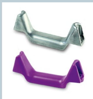
Spurbügel / Tireguide

© HANS HALL GmbH, 04/2023 Änderungen, Druckfehler und Irrtümer bleiben vorbehalten. Farbabweichungen in den Abbildungen von den Original-Produkten sind drucktechnisch bedingt. Changes, misprints and errors excepted. Color deviations are due to printing technology.