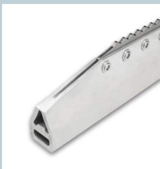
Steg / Cleats