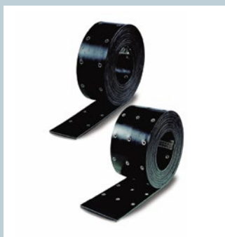
Bänder / Belts